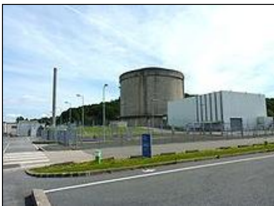
La centrale nucléaire EL 4 des Monts d'Arrée

Ce sont les Canadiens qui ont porté le réacteur à eau lourde au stade de grand compétiteur mondial des REP avec le CANDU (CAN : Canada, D : deutérium oxide, U : uranium naturel). On peut dire que le réacteur à eau lourde est le fils naturel de Frédéric Joliot-Curie et de la technologie canadienne.