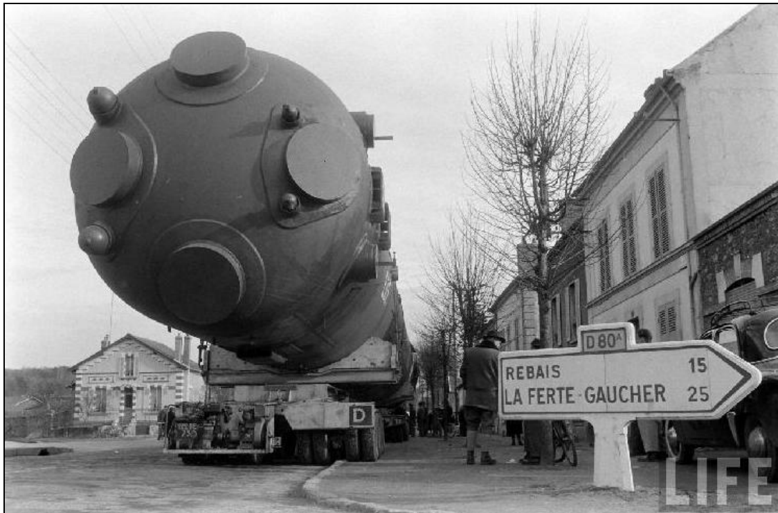
Transport de la cuve de la pile Zoé vers le Fort de Chatillon (CEA Fontenay-aux-Roses)

Le premier réacteur nucléaire à eau lourde, refroidi au gaz 1 est la pile Zoé au fort de Chatillon du CEA de Fontenay-aux-Roses.