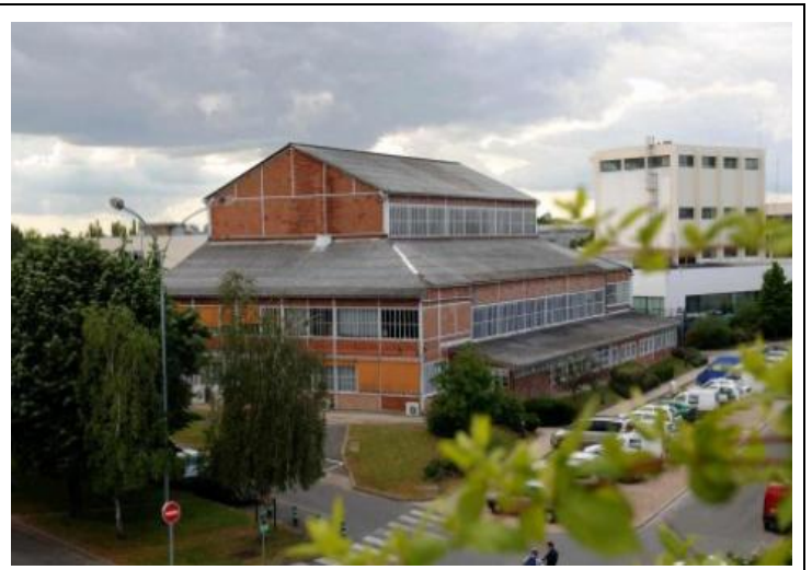
Vues extérieures du bâtiment Zoé à Fontenay-aux-Roses

Elle sera suivie par la pile EL2 (eau lourde n°2) à Saclay, puis par la pile EL3 toujours à Saclay, pour laquelle l'eau lourde jouait à la fois le rôle de modérateur et de fluide primaire.